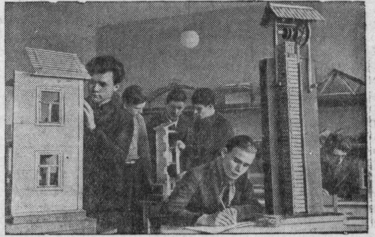
Студенты Лесотехнического техникума в гор. Кякисалми (Карело-Финская ССР) на занятиях в лаборатории строительного дела.

ВКП(б) райкоммезлб колб решительнбя кончитны бняся практикасб да бни жб кутчыны ВКП(б) ЦК-лись август 20 лунся постановленнё сьбортб газетазлись исправляйтны недостаткозб, кореннбя мдккодсьотны нылис уджсб, бурсьотны содержаннёсб. Отсавны газетазлб сиббтны дыванис партийной, советской, комсомольской активбс и промышленность да сельской хозяйствозис стахановцеазб, кднн лонисб бы активнй корреспондентэзбн, да лэбтыны вылынжыка газетались культурасб, бурсьотны сылсб кывсб да технической оформленнёсб.