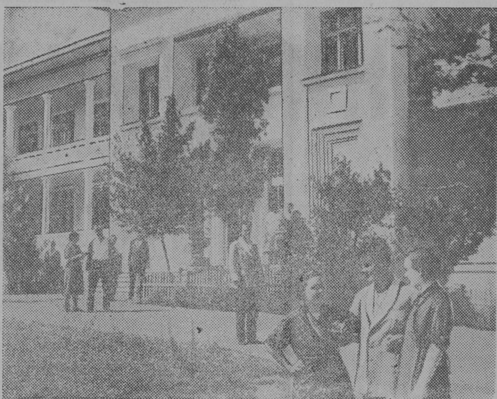
В 15-ти километрах от Сталинграда открыт туберкулезный санаторий „Горная Поляна“. На снимке: У главного здания санатория.