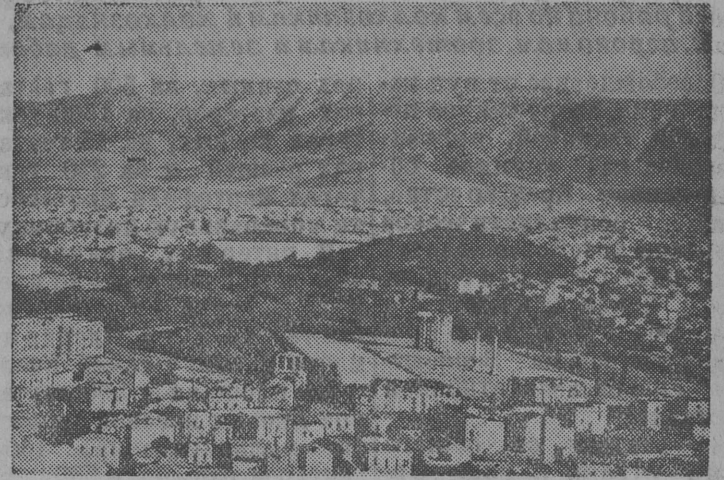
На снимке: Город Афины — столица Греции.