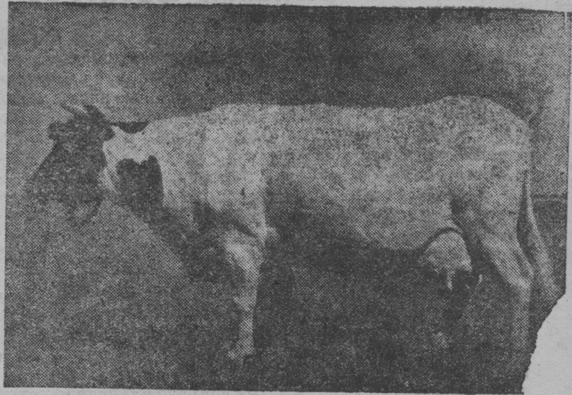
СНИМОК ВЫЛЫН: Мэс „Муська“, 1937 гэдлын 300 лунэн йэв сетис 6307 литра. жирностьлэн процент 3,8. Вылын суточнэй удой 37,5 литр. „Муська“ босьтэм Всесоюзнэй сельскохозяйственнэй выставка выла.

Свердловскэй областись, Тагильскэй районись Отто Шмидт нима колхоз готовитэ экспонатт'ез Всесоюзнэй сельскохозяйственнэй выставка кежэ.