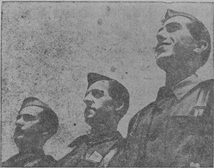
Снимок вылын: республиканскэй воздушнэй флотись том летчиккез.