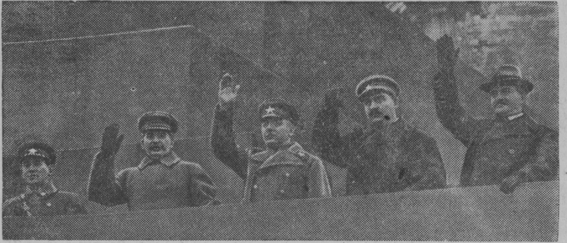
Снимок вылын: партиялэн да правительстволэн руководителлэз (веськытлань-сыянь шулъгалань) В. М. Молотов, Л. М. Каганович, К. Е. Ворошилов, И. В. Сталин да Н. И. Ежов приветствуйтэны демонстрантт'езэс.

Великэй Октябрьскэй Социалистическэй Революциялэн 21 гедовщина Москваын 1938 годэ ноябрь 7 лунэ празднуйтэм.