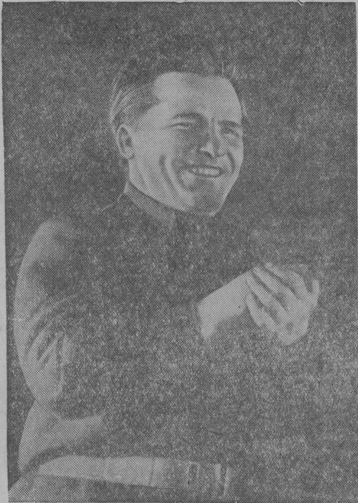
Снимок вылын: С. М. Киров V Ленинградскэй областнэй да II городскэй партконференция вылын (1934 г.)

Великэй да непобедимэй народ, кэда чужтэ с'етшэм мортт'езэс, кыз Сергей Миронович Кировэс. Непобедимэй страна, кэда имейтэ с'етшэм партия, кыз Всесоюзнэй Коммунистическэй партия (большевикезлэн) да великэй Сталинэс.