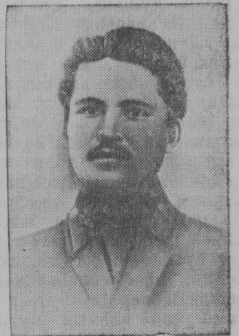
Снимок вылын: С.М. Киров—РСДРП-ись Томскэй комитетлэн член. 1906 год. (СССР-ись Революциялэн Музей).

Дело, кэда понда Сергей Миронович сетіс ассис быдэс олэмсэ, олэ да победайтэ. Сы понда сулалэ быдэс советскэй народ да уджаліс человечество.