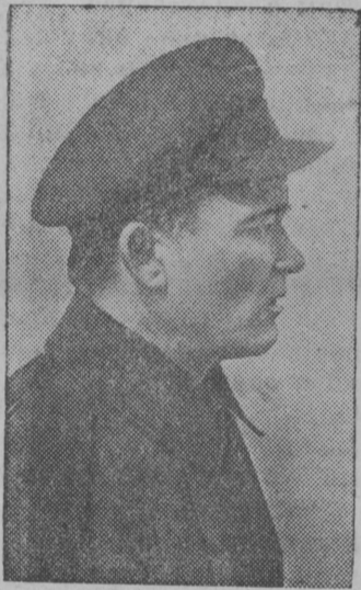
Снимок вылын: Сергей Миронович Киров Сталиннима Беломорско-Балтийскэй канал строительство вылын 1932 годэ

Костриковвезлэн семья, кэдаын чужис Сергей, овліс этік убогэй комнатканы. Сыын сулаліс токо пызан, куйм тубаретка да пуовэй скамьяез. Сергей быдмис крайнэй бедностьын—сапоггез ез тэдлы нельки школаэд: гожумнас кэмтэг, а тэвнас бырэм нимезэн. 7 годся зоночка кольччис сиротаэн. Сетісэ сійэ детскэй приют. Тшэктісэ велэтчыны матісьжык церковно-приходскэй школын.