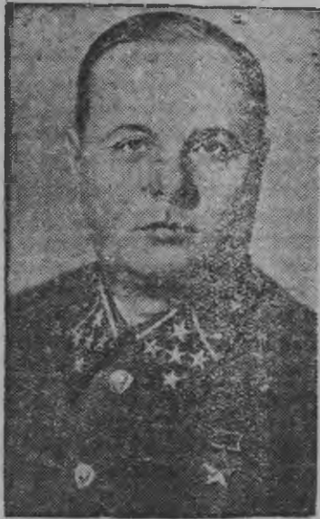
РККА-лэн Генштабелэн началь- никез, армилэн Генералэз Ки- рилл Афанасьевич Мерецков.

Вань та азын сылсь уж'ессыз Великой Октябрь-лэн XXIII годовщинаезлы дасяськон лозунг улсын быдэс'яны кулэ. Колхоз'есын, бригадоосын, звеноосын но колхозник'ес пöлын организовать кароно пред-октябрьской социалистической соревнование.