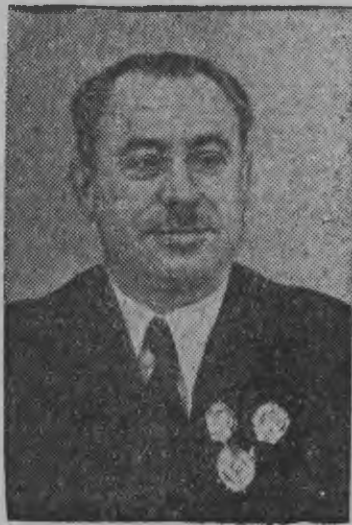
„И. Сталин“ ледоколлэн экспедициезлэн начальникез — Советской Союзлэн героез И. Д. ПАПАНИН эш.

СССР-лэн СНК-ысьтыз Главсевморпутлэн начальникез И. ПАПАНИН. „И. Сталин“ ледоколлэн капитанэз БЕЛОУСОВ. „И. Сталин“ ледоколлэн бортез 1940 ар, 29 январь, Мурманск порт.