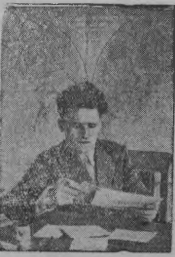
СУРЕД ВЫЛЫН: И. Ф. Игони колхозлэн председателэз колхозлэн правленияз почтаез разбирать каре.

ВСХВ-лэн участыкыкылы „Красной Октябрь“ колхозлы (Ракшинской район, Тамбовской область) Главывставкэмен сетэмын одиг степене диплом. Колхоз басытыз преми 10.000 манет коньдонэн но легковой машина.