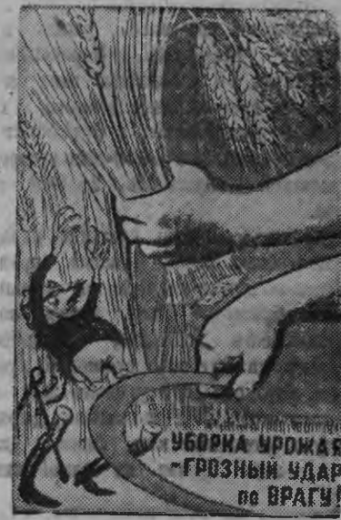
(Искусство“ издательствоен поттэм плаватясытыз репродукция).