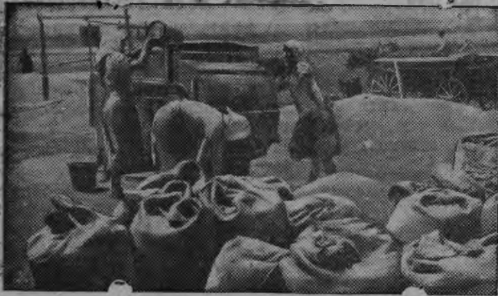
Ворошилвлэн нимыныз нимама колхозлэн луд вылаз (Спартакковский район, Одесской области) 2-ти номеро бригадын тьшь шерто.