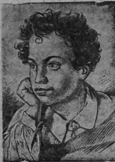
Пушкинлэн пинал дырыз

Пушкинской комитет вань фотограф'ёслы но фотолюбитель'ёслы суред'ёссэс ныяны курсыз вазиськыз. Суред'ёс сётэмзы понна дун тырны тупатэмнн.