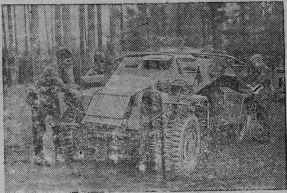
Немецкой бронемашина, боец'ёсын трос басытэм трофеяос пёлысь одйгез (Западной направление)