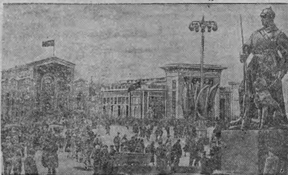
Выставканын колхоз'эслэн плошадьзы.