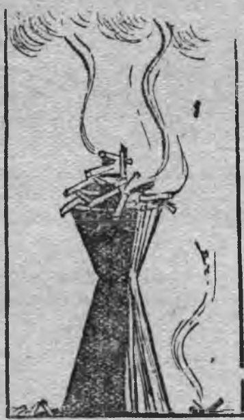
но соослэн продукциясы