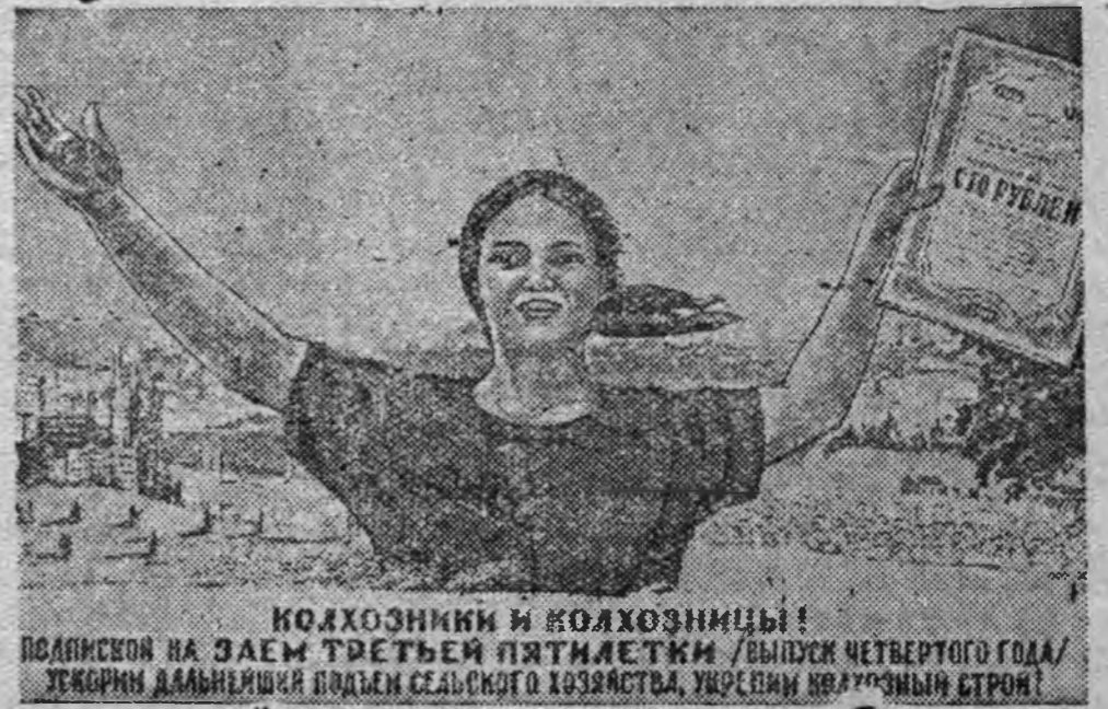
КОЛХОЗНИКИ И КОЛХОЗНИЦЫ! ПОДПИСАНЫ НА ЗАЕМ ТРЕТЬЕЙ ПЯТИЛЕТКИ / ВЫПУСК ЧЕТВЕРТОГО ГОДА / ТЕКСТЫ ДАЛЬНЕЙШЕЙ ПОДЛЕН СЕЛЬСКОГО ХОЗЯЙСТВА, УКОСНЫИ ИВРАЗИИИ СТРОИ!

Райсберкассалэн сведенияосыз'я толон 9 часэ жытазе азе 395 мурт рабочийёс но сдужэщийёс 106 сюрс манетлы гожкызы.