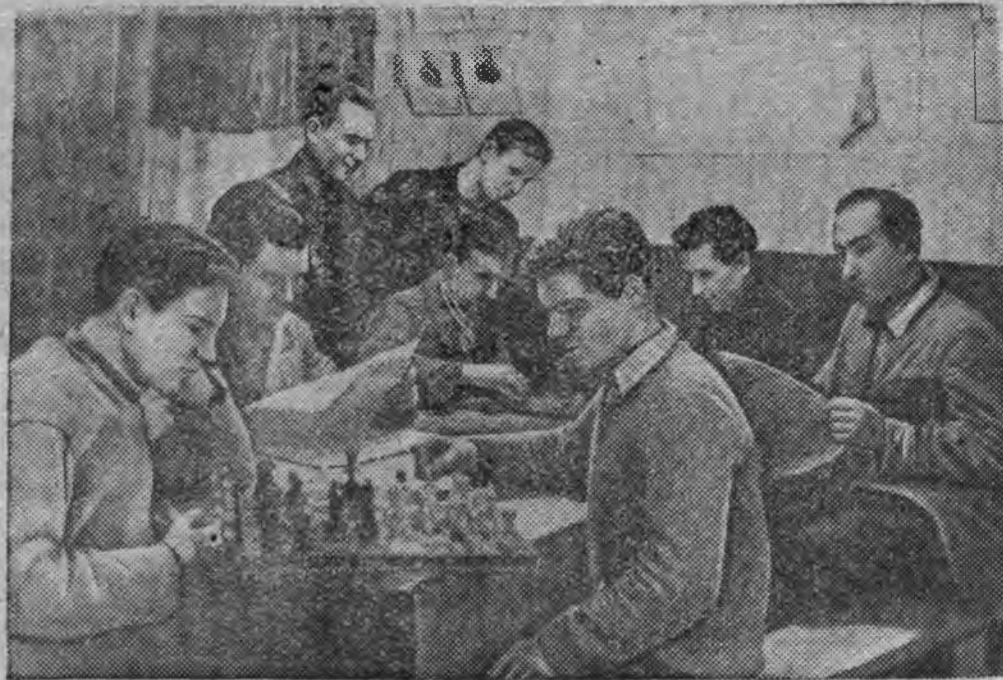
Выходной нуналэ колхозной клубын.

8 Мартлэн нимыныз нима колхозын (Московской область, Ленинской район) выльысь оборудовать каремын колхозной клуб. Колхозэн басьтэмын библиотека-передвижка, басьтэмын музыкальной инструмент'ёс, биллиард, шашкаос но шахмат'ёс.