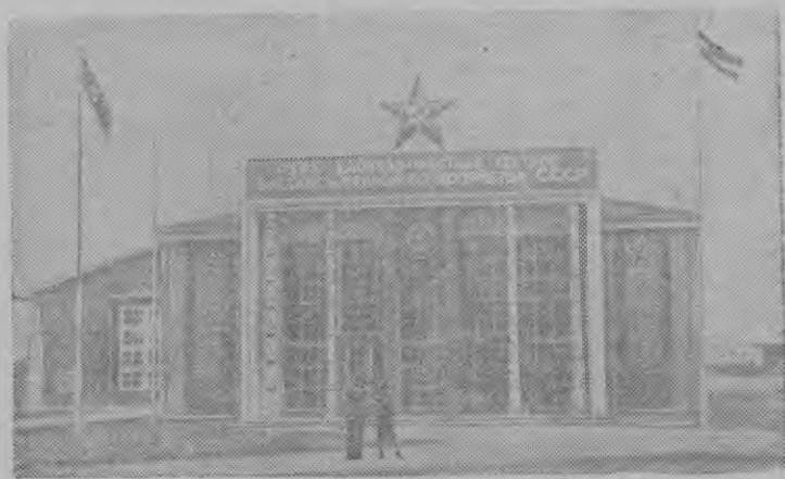
Павильонлэн ог'я тусыз.

Латвийн СССР-лэн сельскохозяйствоезлэн выставкаез.