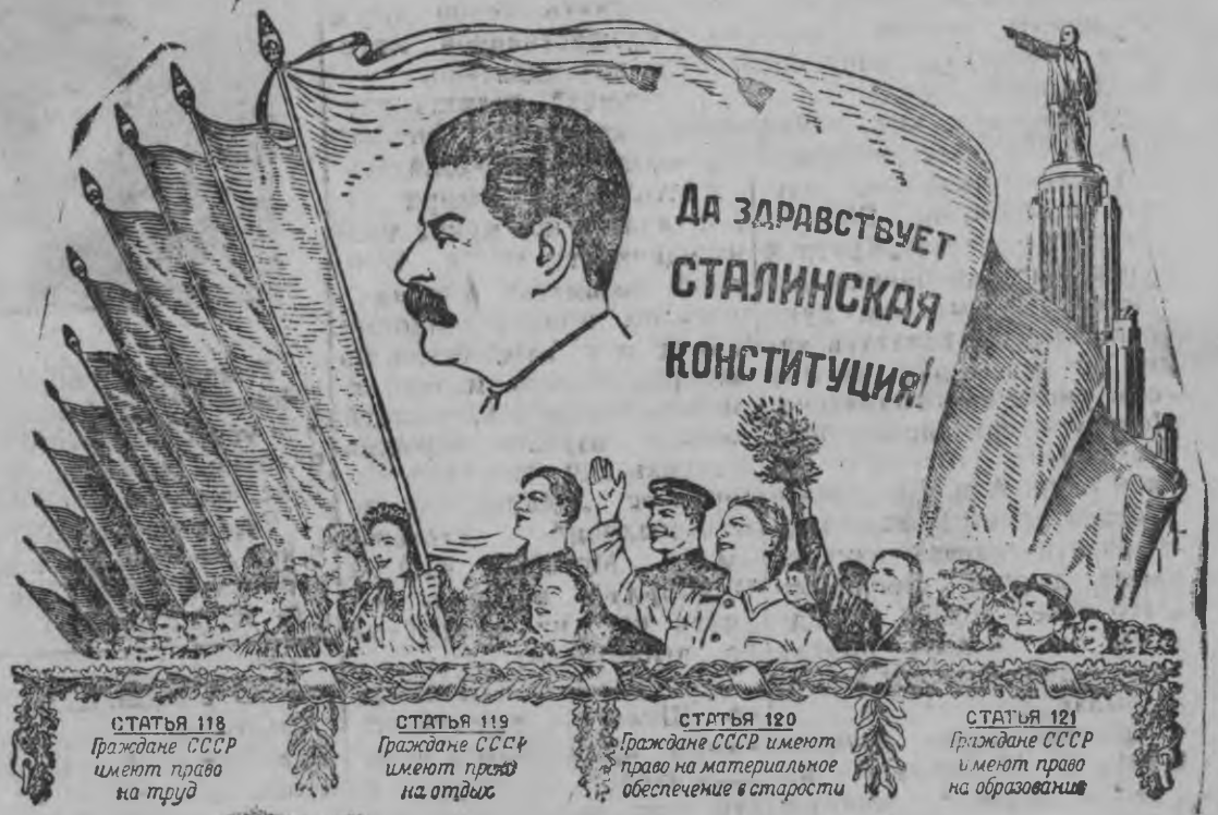
Рисунки В. Барковлэн но В. Лисовичлэн

Сталинской Конституцилэн шундыез сиять каре пока земной шарлэн куатьмосезлэн одйг локетаз. Асьмеос, Советской страналэн калык'ёсыз, куд'ёсыныз кивалтэ Ленинлэн—Сталинлэн паризы, увереннось, что коммунизм победить кароз быдэс мирын.