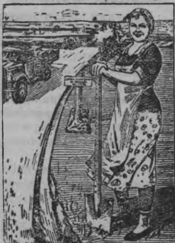
КОМБАЙН-НА ПЕРВОНАЧАЛЬНОЙ ФОРМЕ ЧАСТИ СЕЛЬСКОГО НАСЕЛЕНИЯ В СТРАНАХ СРЕДНЕГО И ВОСТОЧНОГО АЗИИ

Рисунок вылын: В. Костин художниклэн плакатэз „Сюрес'есыз лэсьтон но ремонттировать карон“ темалы, кудыз лэземын „Искусство“ издательствоен.