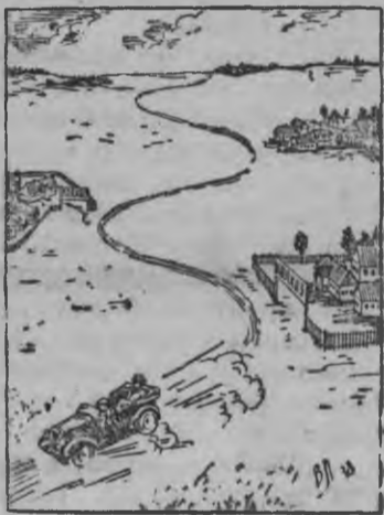
МТС-лэн кивалтысьёсыз комбайновой агрегат'есы вуыло ке но кычэ юрттэт сётытэк, туж ж гуртазы бертыны дырто.