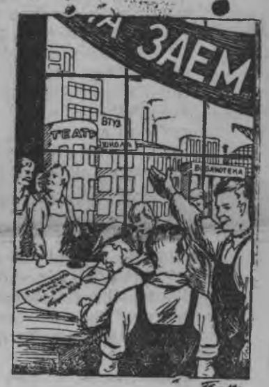
Асьмелэн заем'ёсмы поистине беспроигрышноес!