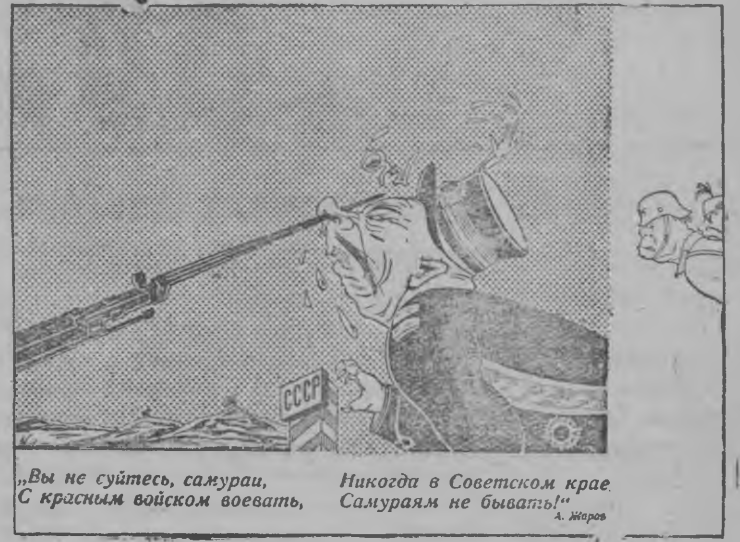
„Вы не суйтесь, самураи, С красным войском воевать, Никогда в Советском крае Самураям не бывать!“

Дени но Долгоруков художник'ёслэн плакатсы, „Искусство“ государственной издательствоен поттэмын.