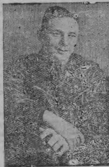
Суред вылын: Советской Союзлэн Героез В. К. Кок- кинаки эш.