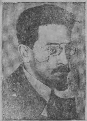
Снимок вылын: Я. М. Свердлов.

Ленинлэн но Сталинлэн верной соратникезлэн, асьме партимылэн но Советской властылэн организатор'ёсызлэн руководителёсызлэн умойёсыз польсы одйгезлэн, ЦИК-лэн председател'езлэн—Яков Михайлович Свердловлэн кулэмезлы (16 март 1919 ар) 20 ар.