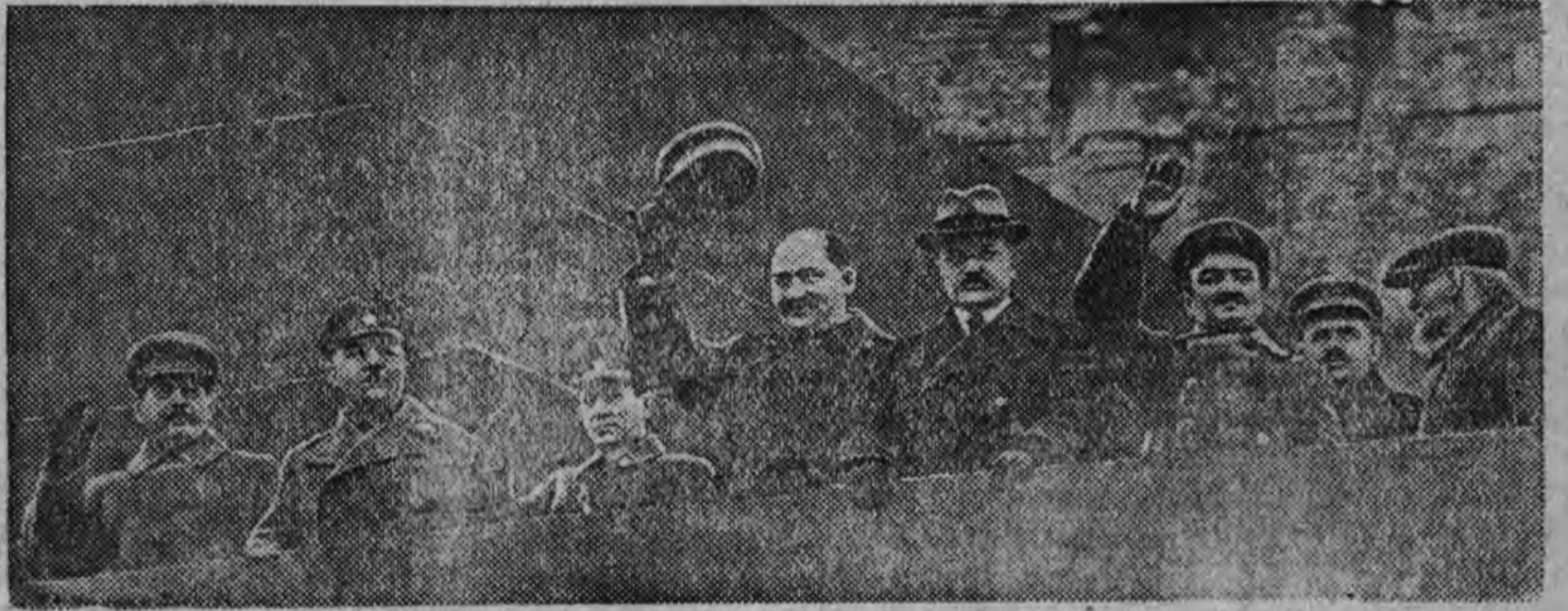
Великой Октябрьской социалистической революциялэсь XXI годовщинаэз 7 ноябре 1938 арын Москваын праздновать карон.

Сельскохозяйственной арез быдэстыса, колхоз'эс активно доходэз люкыны даясько. Валовой доходлэн общей суммаезлэн солидной доляез тросаз колхоз'эсын етйнлэн доходэзлэсь усе. Но со доходлэн размерез зависит кароз со оордысь, кызы етйнэз обработать но трестаз государственлы сдаты карон ортыгытэмын луоз. Таын доходэз бюджетны быгатонлык исключительно бадзым. Жоггес е йнлы беспенной отношениез быдтоно, каждой килограммэз етйн куроэз но мертчанэз сохранить кароно но шонер гинэ использовать кароно.