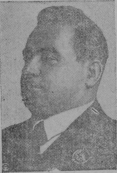
Начальник новой полярной станции, краснознаменец т. И. Д. Папанин.

„Над белым безмолвием арктических пустынь гордо поднял великий флаг Союза Советских Социалистических Республик. Северный полюс завоеван нами“.