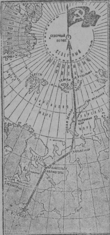
Карта перелета Советских полярников.

ности может каждый, но в тоже время можно пройти мимо врага.