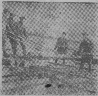
Б. Визинга ю устье запаньян

Кыдз юртӧны Койгорт да Гагшор мехвӧрпунктъяссян, пуръялӧм да формируйтӧм поромъяс примитӧм да запаньясӧ мӧдӧдӧм сплавса веськӧдлысьяс задерживайтӧны, мыйӧн поромной сплав ӧдзӧдӧм пыдди нӧждӧны кылӧдчан срокъяс. Сплавной уджъясӧн оперативной веськӧдлӧм пыдди Сыктывса сплавной участкаын весиг оз тӧдны, унаӧ эм берегъясин формируйтӧм вӧр, кодӧс колӧ примитны да пыржӧ мӧдӧдны запаньясӧ.