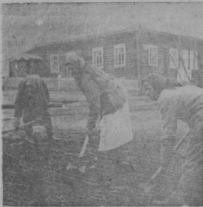
Горьковскöй сиктсоветса Максим Горький нима колхозысь колхозницаея ремонтуйтöны туй.