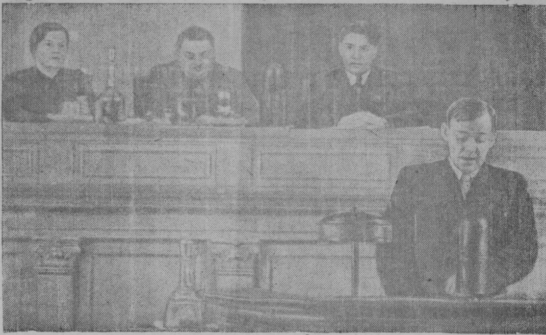
РСФСР-са Верховной Совет Нельöд сессия вылын Финансьяс кузя Народной Комиссар А. А. ПОСКАТОВ вöчö доклад.

Советской странаса колхозьясын да совхозьясын апрель 5 лун кежлө көдзöма ярöвöй 5.308 сюрс гектар вылö — 2.495 сюрс гектар вылö уджык, мыйта вöдлө көдзöма колбём воö тайö жö кад кежлас. (ТАСС).