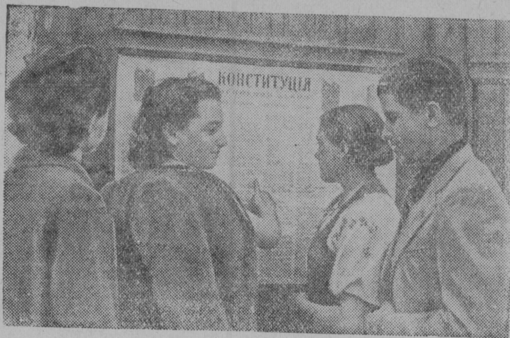
Снимок вылын: Кишинев карса олысьяс лыддьоны Сталинской Конституция.