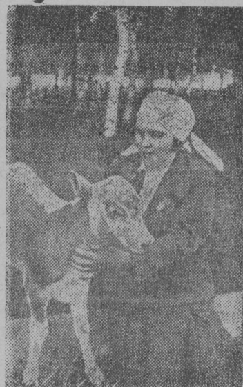
Снимок вылын: А. И Филиппова аслас питомецөн.