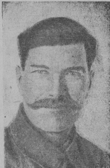
Снимок вылын: М. Е. Ефремов.

...1938 воын выдвинётма Барнаульскэй государственнэй селекционнэй Станцияын Ефремовскэй агротехника кузя отделён заведуйтгъясён.