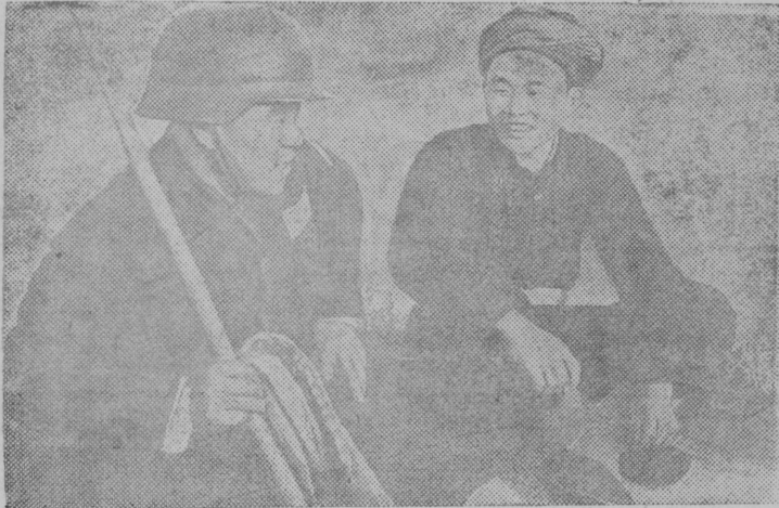
Філімк вылын: Кітајској крестанін сорніт фронт выло муныс кітајској арміјаса бојешкд.