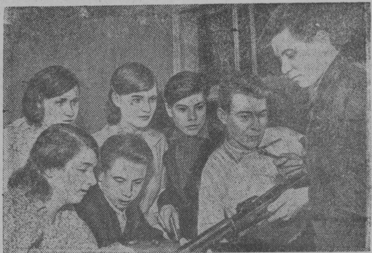
СНМОК ВYЛЫН: „XII Октабр“ колхозса комсомолецаслdн группа стрелковōй кружкōдн занатїе вылын. (Лєнїнградскőй обл.)

„Осоавиахим ем массовōй доброволнőй, общественнőй организација, нубдō ыжыд да полезнőй уж... Мї вермам да обзјанōс матыса кадын вōчны ставсō сымогыс, медем Осоавиахим аслас организацијајас систематїс шымыртїс став фабрикајас да заводјас, предпрїатїејас, учрежденїејас, учебнőй заведенїејас да колхозјас“. (ВОРОШИЛОВ).