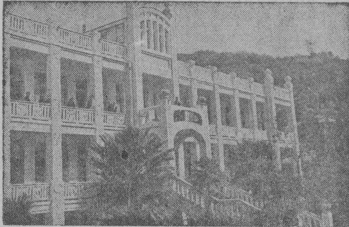
СНИМОК ВЫЛЫН: Абхазскöй АССР-са курортнöй управлени- желди санаторија Сухуми карын.