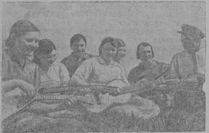
Полевбй стайны. Селявки ёрт бригадаса трактористьяе да принципияе шойччбны ббеденбй перерыв дырйи.

Сальской районны (Ростовской область) Селявкн ёртлөн (Сальской МТС) передовой тракторной бригада систематически перевыполняйтө нормаяе да экономитө горючөй. Бригадаын культурной да разумной котыртөма шойччөг.