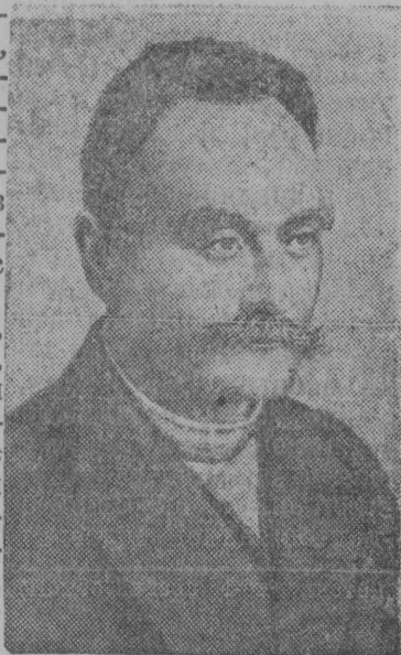
И. Я. Франко.

Май 28 лунё тырё 25 во выдающёйся украинской писатель да ученёй И. Я. Франко куланлунсянь.