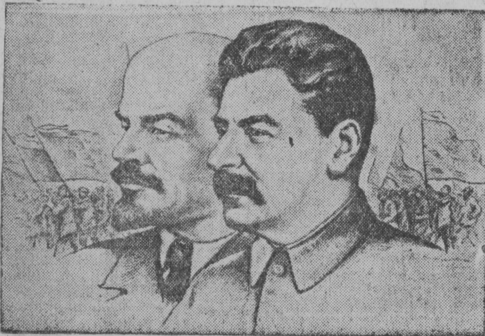
В. И. Ленин и И. В. Сталин.