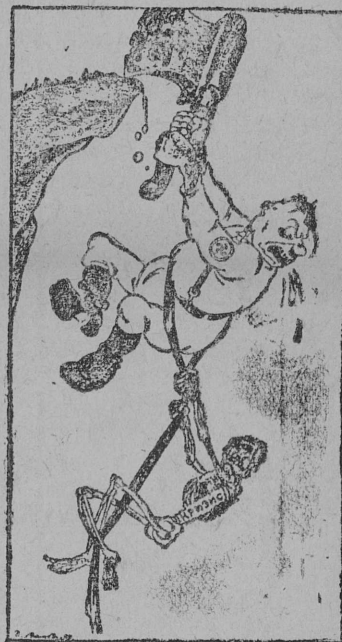
—Если ты меня не отпустишь, я тебя ударю топором. Рис. Г. («Прессклише»).