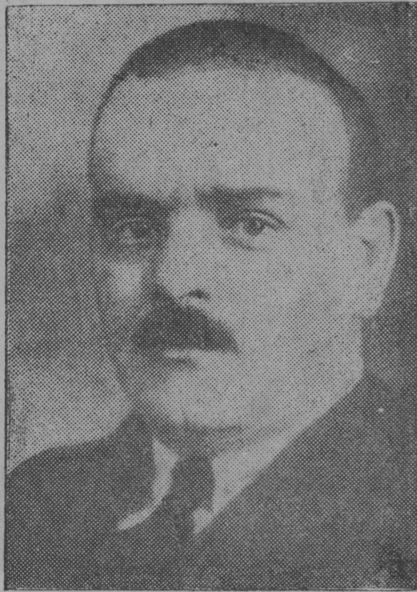
Николај Михајлович Швернік