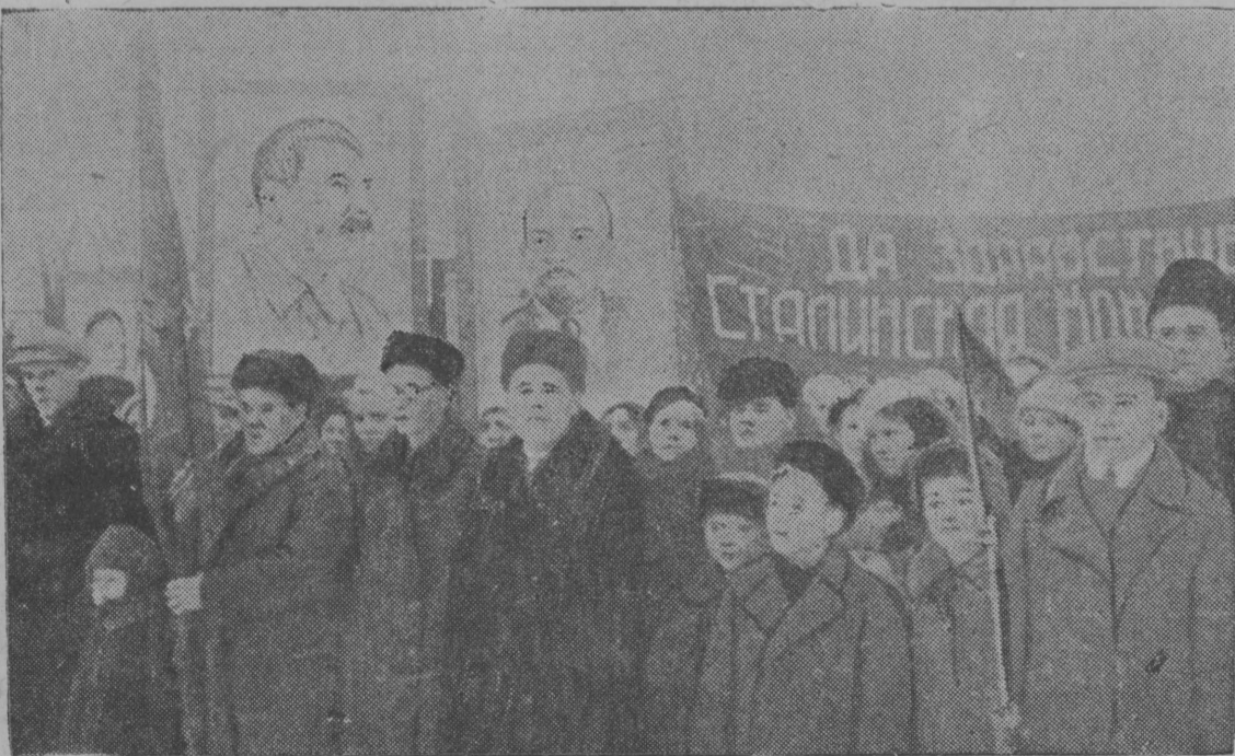
Фөкабр 5 лунө Сыктывкарын Краснөй площад вылын мунїс ужалыс јөзлөн Сталинскөй Констїтуцїа лунлы сїб мїтїнг. СНИМОК ВЫЛЫН: Мїтїнглөн общөдөй вїд.

аскадө тыртны ас вылө бөвтөм көсјысөмјас. Бригадїр В. Југөв.