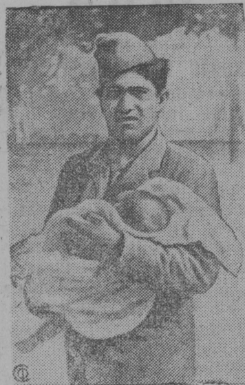
Šnimok vbln: rabočaj milici- jalən vojec kagaən, kədə peikə- tis mjateznikkezlən samolottez vi uvtiš, kədnija bombardirujtisə Šerro Muljano šelənoəs.

Madridə loktis podkreplə- no 3000 vojciš. Juərtənb siz-zə, sto Madrid tuj vbln em Katalonskaj vojskaezlən vbt otrjad. Mjateznikkezlən vbdəs porptkəez okoppez linija orətəmbn terpitisə ne- dača nevizətəmbn sb vblə, sto mjateznikkezən vli lezə- maš artillerija, samolottez, ogņemjottez da tankkez. Nojavr 8 lunə čulaləm sra- zenno vli med ozestočennə- nej Ispanijašn grazdan- skaj vojna vojjeziš.