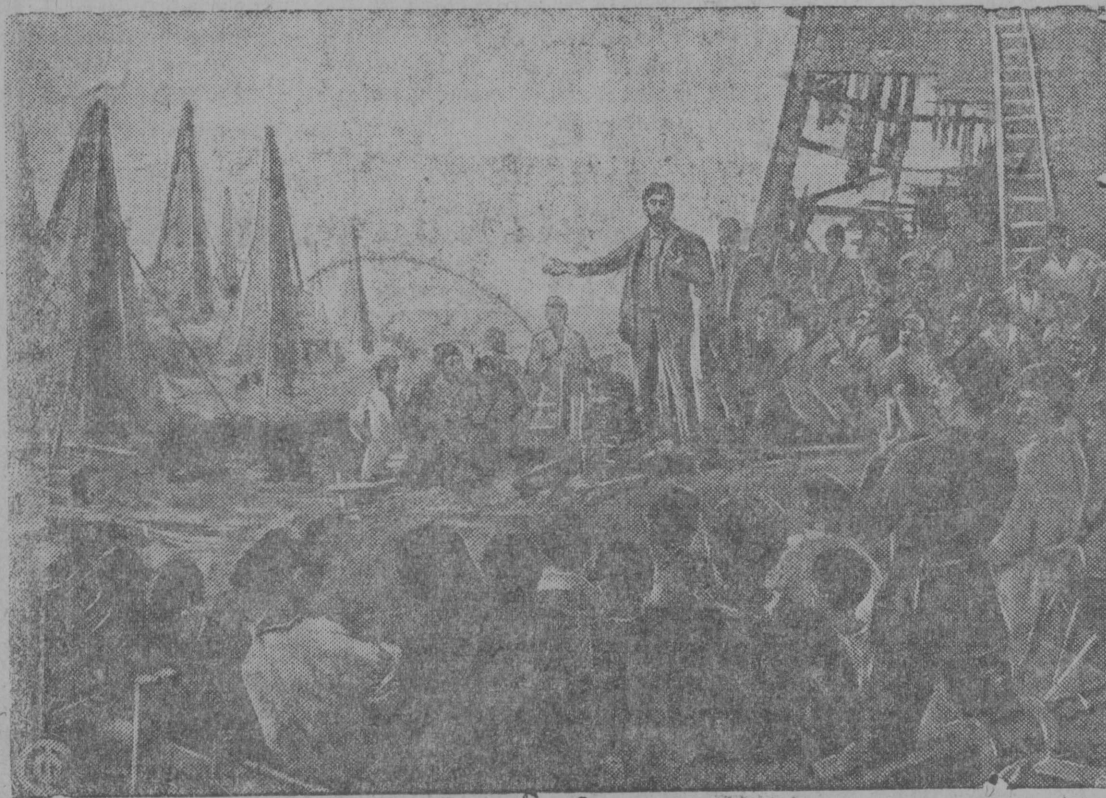
Xudoznik V. Šidamon—Ēristovalēn kartina „Vskāez pondisē vērātčēnē“— jort Staļin organizujtē vakinskāj ravočājezēs.