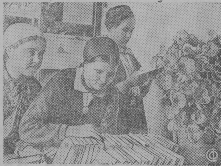
„Elektra“ kolhozlān klub (Tatarija) Kukmorskaj rajonyn iuddiššā medburān.

Klubyn organizujtm biblioteka, kāda obsluzivajtā kuim kolhoz. Šnimok vьln: Kolhoznikkez komsomolēcez „Elektra“ kolhoziš bibliotekān vārjēnь knigaez.