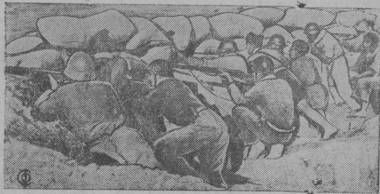
Šnimok vьln: Ravočej mišicijalən otrjad me- džza pozicijaez vьln. (Aragonskəj front)