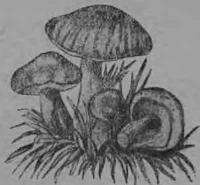
12-ця Шяй грипт (маслята).

Мзярда панкня лакафтомать эзда тиендихть кемя озафкс котёлть потмаксозонза, эста панксь лувондови пидефонди.