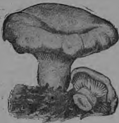
4-ця тяштьксь. Панкт (грузди).

Корянец улеза керьф панкть коряненц палец, лядыкссь кепотьксонди, улеза 2\frac{1}{2} см.