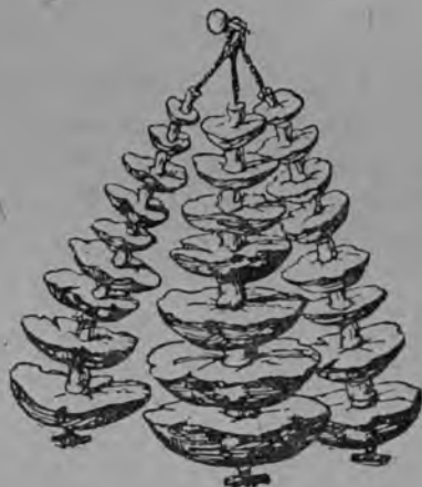
1-ия тяшткьссь. Коськя пангонь кяркстамась.

Но пяк пси пянакуца (45 градузда лама Реомюрть ко-ряс) панкня ряставихть, сёрмиякшнихть, равчкодыхть, ня-