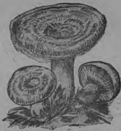
7-ця тяштъкссь. Келналонь панкт.

Хоть салыяфтомать тиенцазь пангонь аноклай организациятя но марстонь столовайнди колхозса, кда улихть кядьгот, коса улихть кода ванфтомс панкня, эряви салыяф немс панкт эстейстка.