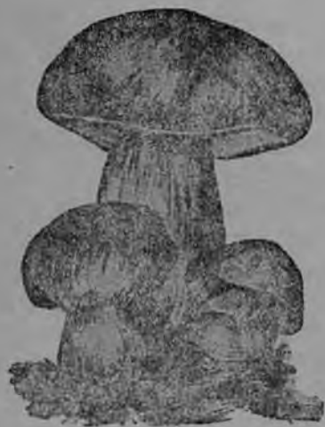
9-ця тяштъкесь. Акша пангт (грипт).

Пицеф акша панкня (грипня). О № сорць. Панкня улест аф суксуфт, кемот, аруфт, сяннь лангсост дяза уль шувар и рдас. Мариновандамда инголя, синнь штакшнесазь веца. Панкня улест аф оцюнят, корянца керьфт шляпканяснон вакска, шляпкась улеза—аф 3—5 см. оцю пидемда и мариновандамда меля