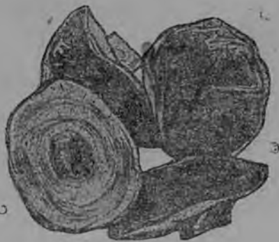
3-ця тяшктьксс. Косьфтафь 1-ця сортонь акша панкт.

Сембодонга цебарь сорць эряви лацкас косьфтамс: вярця шляпкать ширец улеза туюя кедь или якстеря кедь мархта, шляпкать алоц — акша, кодамовок пятнанят эсонза