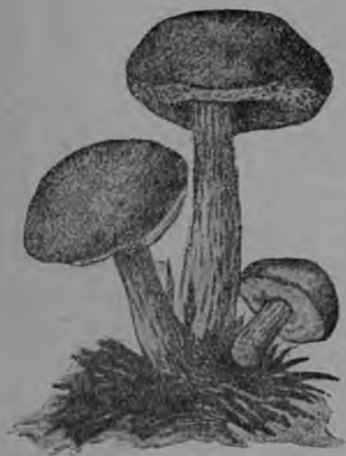
11-ця тяштьксьс. Келналонь грипт.

Пяк вишка тол лангса панкня пидевихть 25 и 40 минутань ётамс. Пяк вишкста лакамста панга мархта котёлть обязательна эряви валхнемс 1—2 минутань ётамс толть лангста, а сята меля танга одукс нолямс.