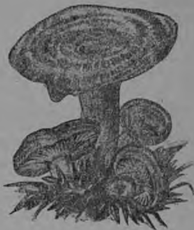
5-ця тяштьксь. Рыжикт.