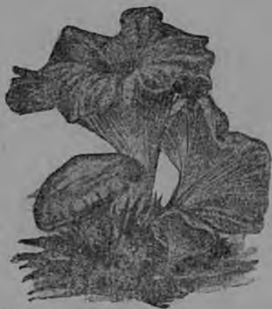
8-ця тяштьксь. Лисичкат.

Пяшкся пяшкотьф парьянь вельхнесазь шуфтонь кружокса, конатнень лангс путнихть кефть. Мзярда панкня озайхть, парьянь танга пяшкочнесазь, плотнайста паннесазь и путнесазь матфу. Матфса панга мархта боцькянять, мзяра мзяра пингонь ётамда меля, геворькшнесазь, а кда боцькянятня кемоста пантфт, эста синнь шарфнесазь омба песной лангс, штоба салу вець, конац тиеви боцькянять эса, равнайста страдоль панкнень ёткова. Сембода пяк эряви ваномс сяннь мельга, штоба боцькянятня афольхть кольга и тялонда панкня афольхть эйнда: панкня рассолфтома равчкодыхть, а эйндафня арайхть дряблайкс и курок колихть.