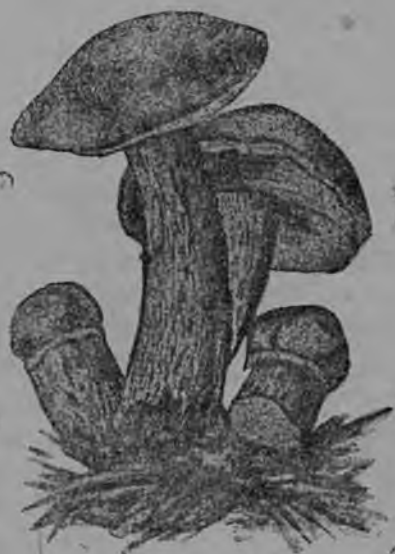
10-ця тяштъкесь. Поюнь грипт.

Панкть шляпкац улеза якстеря кедня мархта, эйкс аци. Панкня коданынга аф эрявихть вельф пицемс и вельф салыяфнемс.