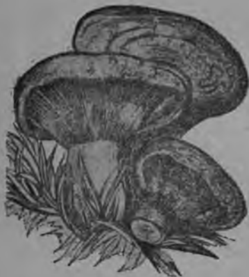
6-ця тяштъкссь. Белянкат.

Лотоксь эсь пензон мархта путневи кафта шава боцькяня лангс, фкя боцькясь путневи лотокть кучканц алу. Лотокть лангс кайсесазь анок панкнень и кочксесазь сортава: О №. сортть фкя боцькясь, васенця сортть—омбоця сортть—колмоця боцькяти. Кда улихть колмоця сортонь панкт, синнь марсесавь нилеця боцькяти. Тяфта жа кочксевихть нят панкневок, коват примсевихть пангонь кочкайхнень кяцта салуста.