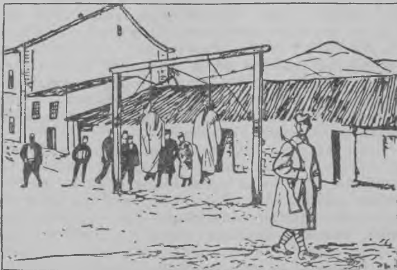
Поваф сокайхня Албанияса.

кода велеса корхнихть—„лисемс ломанькс“. Но тя тевсь аф пяк сидеста улэнди. Капитализмать пингста эрь 100 середнякста кулакокс арай фкя ломань—кулакокс стака лисемась, а 99 ломатня обязательно гурькстихть аду пантг ашутнень шири и мекпяльти повихть заводу или фабрикав, аф ток кулыхть вачеда ошень ульцятнень эса.