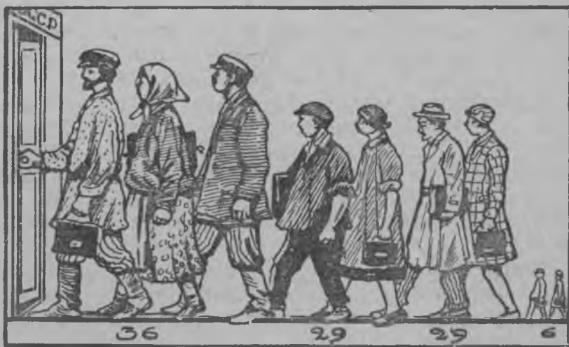
Сокайда. Рабочайда. Служащайда. Лияда.

Варжада велень советть лангс. Кия тоза кочкаф? Эхярь ашуфт, батракт ди середняк сокай ломатть А вов тя картинканянь эса няфтьф, мзяра сокайдя рабочайдя и лияда ащесть уездонь и округонь исполнительнай комитетнень эса 1927-ця кизонда.