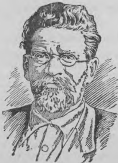
СССР-нь ЦИК-ть председателец Михаил Иванович Калининь.

Миннь масторсонок диктатура. Ингольдень корхнематнень эса минь мархтонт ни ванондоськ, што диктатурась—тя власть, кирьди сон вийть лангса, тя власть аш кирьдиец, аш кардаец, соннь сонцень законнза, кодапт мялезонза, стама закотт нолдай. А тяни тьяконь лангс эряви лездоме, што миннь диктатуранеськ—тя—эряйхнень оцю пялькснон властец, и тя оцю пялькесь люпштасы аф оцю капиталистонь марнять.