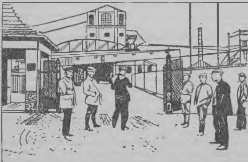
Забастовщекня кинигя аф полясазь фабрикав.

Штоба люштамс, повамс рабочайхнень, капиталистня тийсть фашистонь союз. Эзост сувсихть трудендайхневок, улихть рабочайхтькя, конатнень капиталистня или вась-кафнесазь, или рамсесазь ярмак лангс, аф так макссихть тейст служба завоца, фабрикаса и учрежденияса. Нят