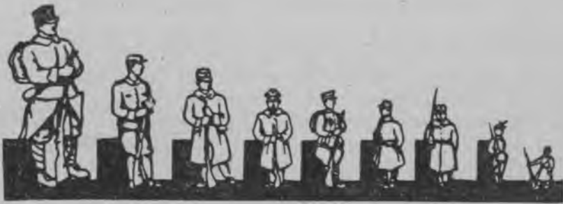
Мзара военной сешенды эрь 1000 ломаньц:

Варжада тя картинанянь лангс и тинцька нийсасть, конашкава кржа ломаннда миннь Якстера армиясонок.