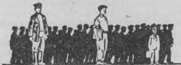
Сокайда—45 Рабочейда—44 Служацайда—11

Комсомольт кемонь кизонзон пяхкодема пингти (1928-ця киз.) эсонза лувондовсь пцтай 2 миллиотт ломань. Варжайнтъ картинанянь эзда, кит синь.