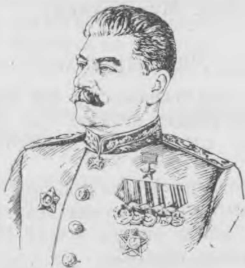
Иосиф Виссарионович Сталин.