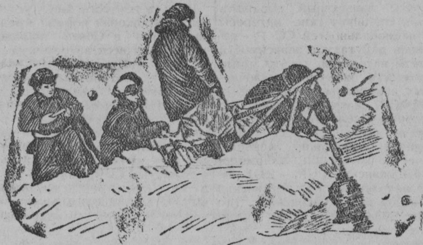
Участники экспедиции берут первую пробу воды на Северном полюсе