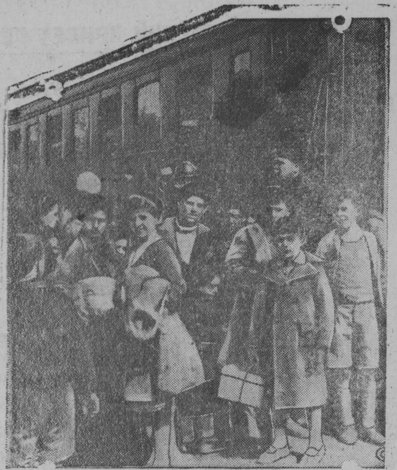
Эвакуированные из Бильбао баскские женщины и дети на вокзале в Ла-Паллис—Рошель (Франция).