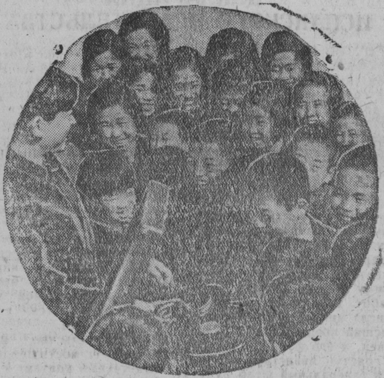
Ребята у грамфона