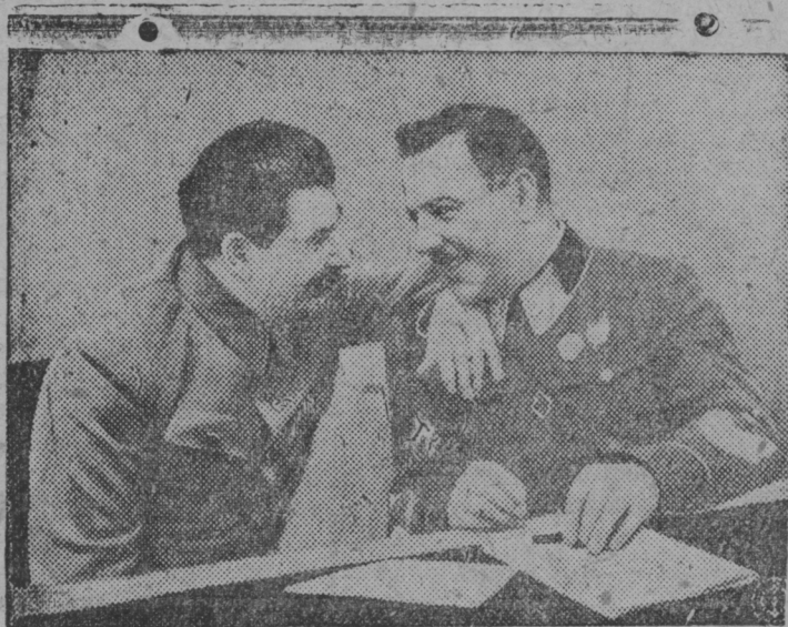
Товарищи Сталин и Ворошилов.

Под руководством товарища Сталина, Наркома Оборона СССР тов. Ворошилова и Наркома тыла тов. Орджоникидзе наша армия увеличила обороноспособность, ее техническая оснащенность поднялась на небывалую высоту.