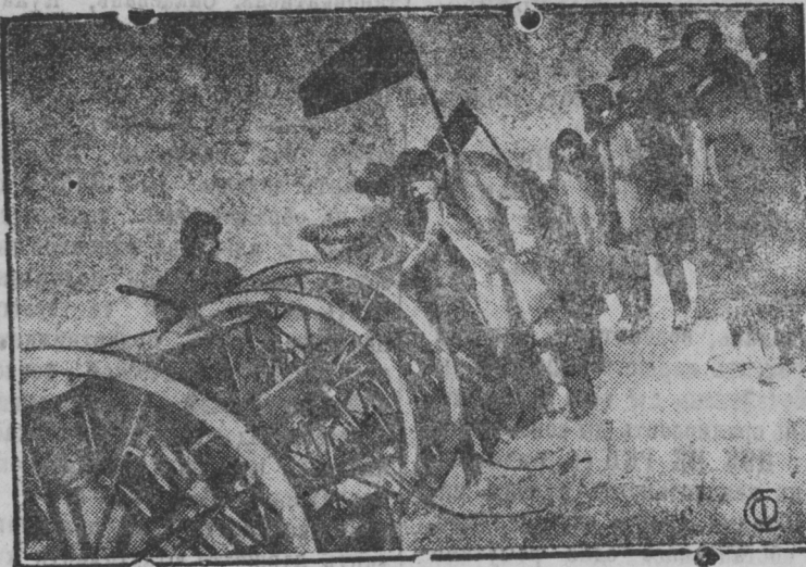
СНИМКАСОНТЬ: Стер.-Шайговань районсо, Шувара велень «Память Ленина» колхозосэ, конась невтезе што колхозосэ видимантень анок