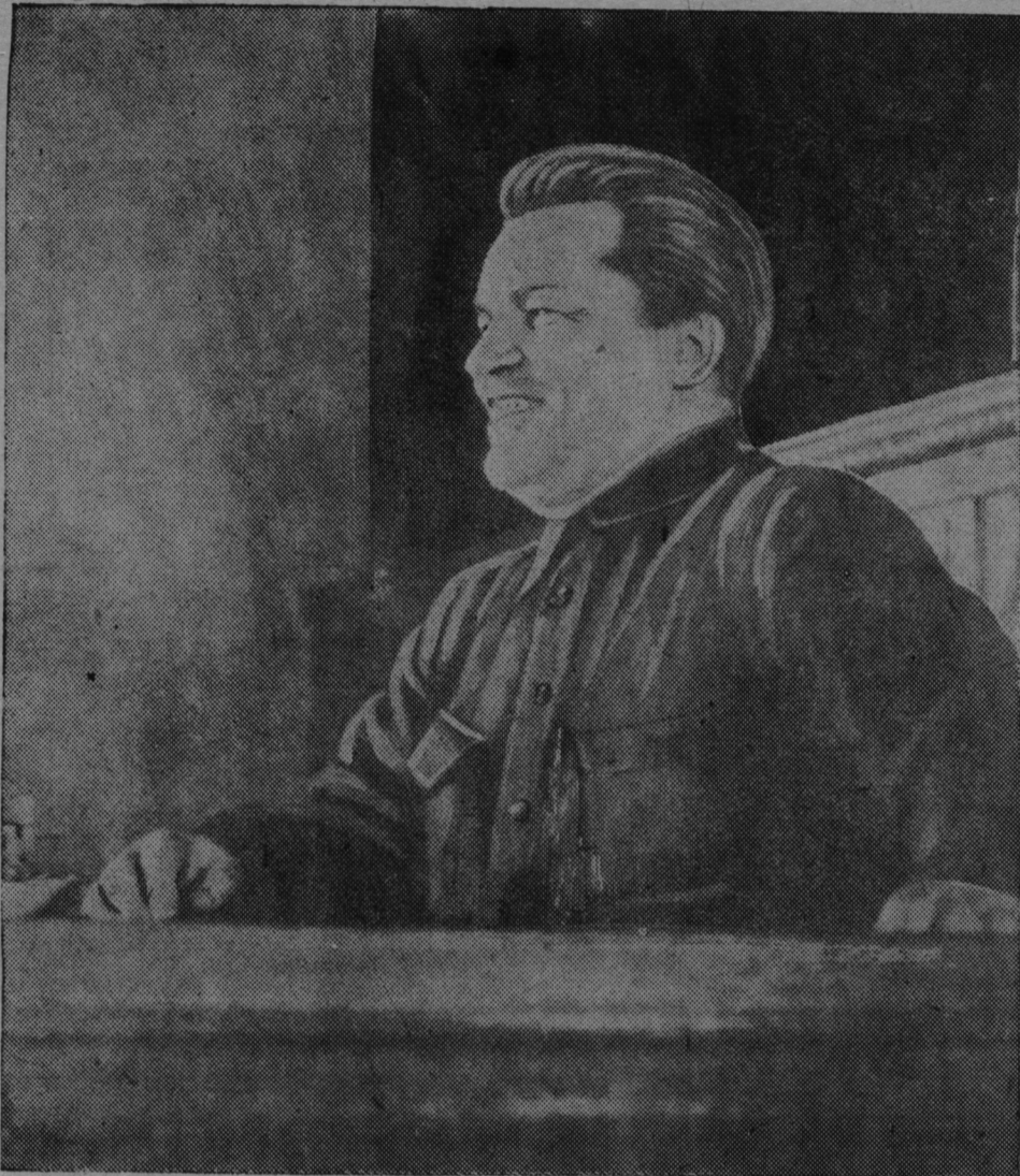
СНИМКАСОНТЬ: С. М. Киров, большевиктень Всесоюзной Коммунистической партиань XVII-це с'ездэнтэ трибуна лангсо.

Уверяю тынк, ялгат, што бути минь тынк марто течи, минек торжествань чистэнтэ, макстано алкуксонь комсомольской большевист-